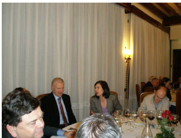
El Presidente, junto con la Consejera de Servicios Sociales, el Rector y el Secretario Gral de la UGT

están entre nosotros. Y quiero agradecer sinceramente a todos los ex diputados las valiosas aportaciones que, a través de las actividades y las publicaciones de la Asociación, y algunos también desde otras tribunas públicas, venís haciendo en el ámbito de la reflexión colectiva. Un tarea inherente a los parlamentos, aunque no exclusiva de ellos, que es im-