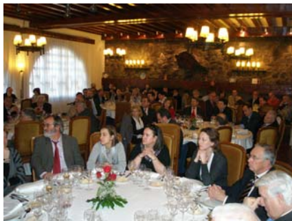
Aspecto del salón donde se celebró el coloquio sobre "Servicios sociales como derechos de ciudadanía"

Algunos escritos sugieren la necesidad de que las propias instituciones reconozcan de algún modo a los que pasaron por ellas y se han reincorporado a la sociedad civil. No estaría de más y sin duda lo agradeceríamos, pero con reconocimiento o sin él, con mayor o menor prestigio social, los que estuvimos y ya no estamos en los distintos parlamentos, seguiremos transmitiendo allá donde estemos la grandeza de la política y la importancia de la participación en la vida pública de todos los ciudadanos.