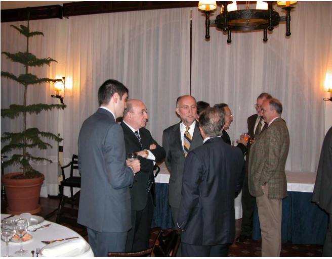
Participantes en la cena departiendo al comienzo del acto

con la exposición Hispano-Francesa de hace cien años, que ha dejado un patrimonio urbanístico muy importante, sino además dejar un legado cultural sobre un modelo de gestión del agua para valorar lo que son el agua y la energía, los dos elementos más escasos y mas importantes que vamos a tener de cara al futuro.